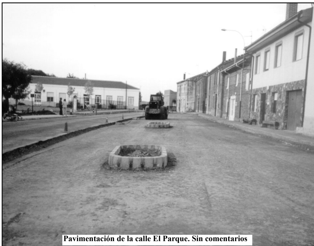
Pavimentación de la calle El Parque. Sin comentarios

8. El río. Aunque la Junta Vecinal ha solicitado la limpieza del río y ha visitado las oficinas de la Confederación Hidrográfica del Duero desde el mes de enero en repetidas ocasiones, está acabando el año y el río sigue sin limpiar. Ya a mediados de 2000 se solicitó la extracción de áridos, pero la lenta burocracia de la comunidad autónoma en unos casos y algunos malentendidos en otros, están consiguiendo que el problema siga sin solucionarse. De momento no ha habido crecidas, pero tanto la zona aguas arriba y abajo del puente, como de El Plantel a La Presa, deberían limpiarse cuanto antes para evitar males mayores.